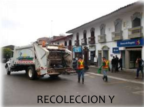
RECOLECCION Y TRANSPORTE DE RESIDUOS