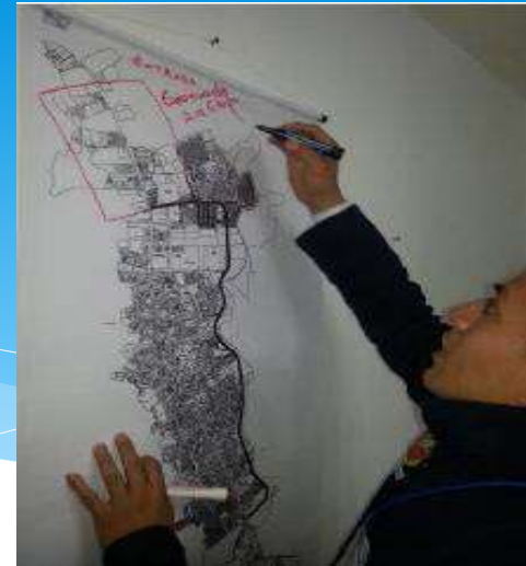
Estudio diagnóstico del sector comercio del Carmen de Viboral