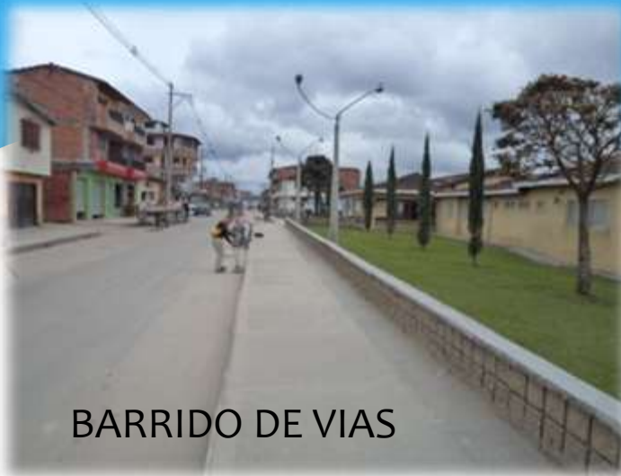
BARRIDO DE VIAS