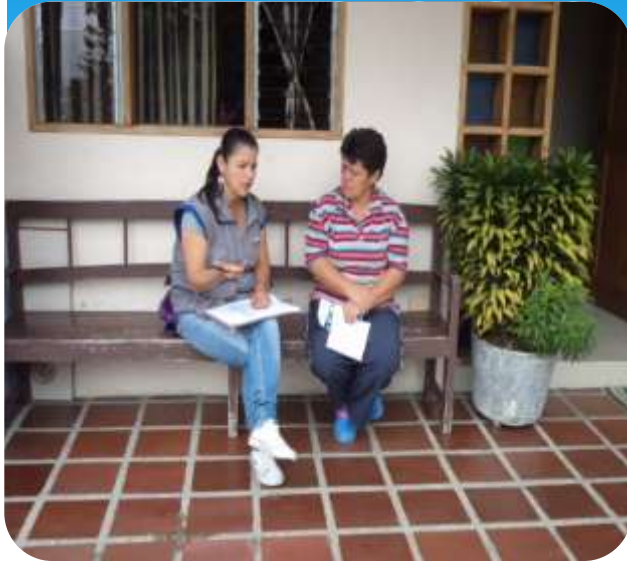
Estudio socioeconómico del servicio de aseo en la zona rural