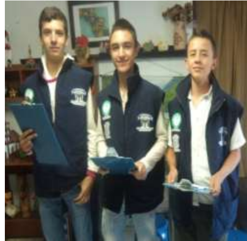
Encuesta sobre la separación de residuos en el comercio